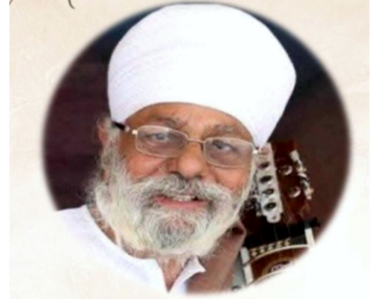
ਉਨ੍ਹਾਂ ਦੀ ਬੇਟੀ ਪੈਰਿਸ 'ਚ ਸੀਨੀਅਰ ਇਕੋਨਾਮਿਸਟ ਹੈ।