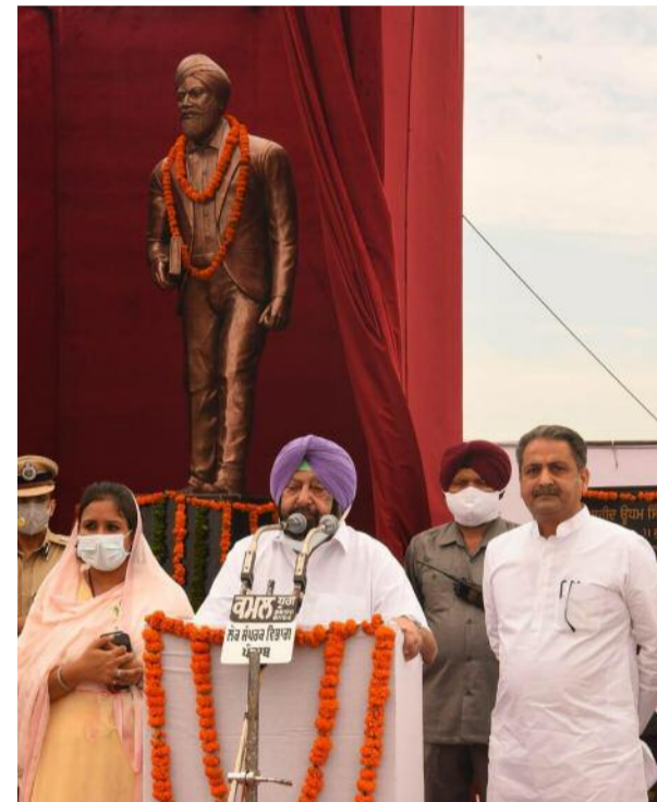
ਬਨਿੱਤਾ ਮਾਰਗ 'ਤੇ ਸੁਰੱਖਿਆ ਬੇਦੋਬਸਤਾ ਕਾਰਨ ਆਮ ਲੋਕਾਂ ਨੂੰ ਪ੍ਰੈਸ਼ਨੀ ਵੀ ਝੱਲਣੀ ਪਈ।

ਸੁਨਾਮ ਉਧਮ ਸਿੰਘ ਵਾਲਾ। ਸ਼ਹੀਦ ਉਧਮ ਸਿੰਘ ਦੇ 81ਵੇਂ ਸ਼ਹੀਦੀ ਦਿਹਾੜੇ ਨੂੰ ਸਮਰਪਿਤ ਰਾਜ ਪੱਧਰੀ ਸਮਾਗਮ ਦੌਰਾਨ ਮੁੱਖ ਮੰਤਰੀ ਕੈਪਟਨ ਅਮਰਿੰਦਰ ਸਿੰਘ ਨੇ ਸ਼ਹੀਦ ਉਧਮ ਸਿੰਘ ਦੀ ਯਾਦਗਾਰ ਲੋਕਾਂ ਨੂੰ ਸਮਰਪਿਤ ਕੀਤੀ। ਮੁੱਖ ਮੰਤਰੀ ਨੇ ਭਾਰਤ ਦੇ ਆਜ਼ਾਦੀ ਸੰਘਰਸ਼ ਦੌਰਾਨ ਅੰਡੇਮਾਨ ਦੀ ਸੈਲੂਲਰ ਜੇਲ ਵਿੱਚ ਸ਼ਹੀਦ ਹੋਣ ਵਾਲੇ ਕਈ ਗੁੰਮਨਾਮ ਨਾਇਕਾਂ ਪ੍ਰਤੀ ਸ਼ਰਧਾ ਤੇ ਸਤਿਕਾਰ ਵਜੋਂ ਇਕ ਯਾਦਗਾਰ ਦਾ ਛੇਤੀ ਹੀ ਨਿਰਮਾਣ ਕਰਨ ਦਾ ਵੀ ਐਲਾਨ ਕੀਤਾ।