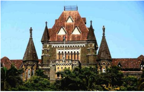
ਰਿਸ਼ਤੇਦਾਰਾਂ ਦੇ ਬੱਚਿਆਂ, ਮਤਰੇਏ ਮਾਪਿਆਂ ਵੱਲੋਂ ਬੱਚੇ ਨੂੰ ਗੋਦ ਲੈਣ ਦੇ ਕੰਮ ਬਾਰੇ ਵੀ ਪ੍ਰਕਿਰਿਆ ਤੈਅ ਕਰਦਾ ਅਤੇ ਇਸ ਦੀ ਮੰਜੂਰੀ ਦਿੰਦਾ ਹੈ।